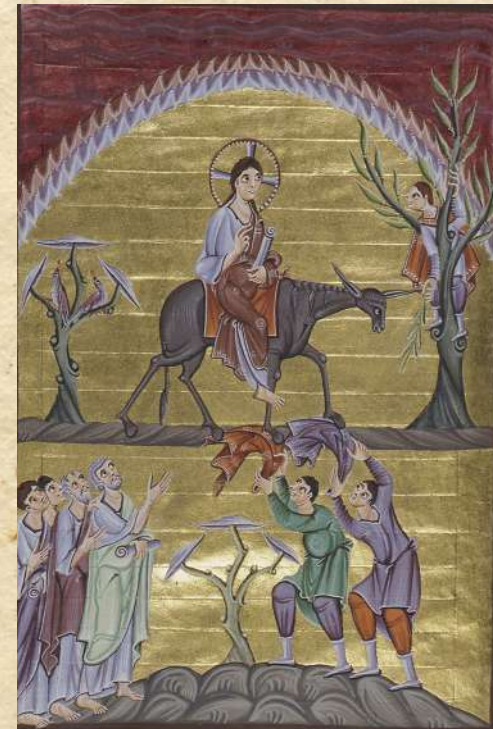
L'entrée à Jérusalem avec les rameaux

Alors, beaucoup de gens étendirent leurs manteaux sur le chemin, d'autres, des feuillages coupés dans les champs. Ceux qui marchaient devant et ceux qui suivaient criaient : « Hosanna ! Béni soit celui qui vient au nom du Seigneur ! Béni soit le Règne qui vient, celui de David, notre père. Hosanna au plus haut des cieux ! »