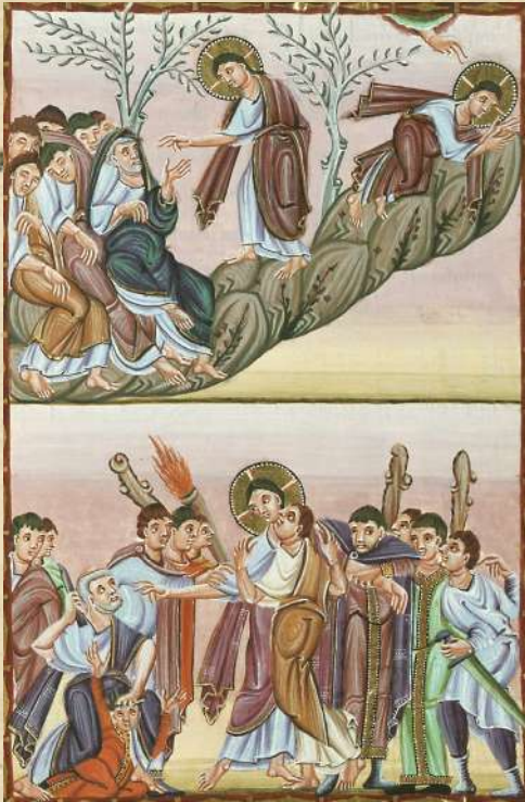
La trahison de Judas

Jésus leur dit: « Mon âme est triste à mourir. Restez ici et veillez. »