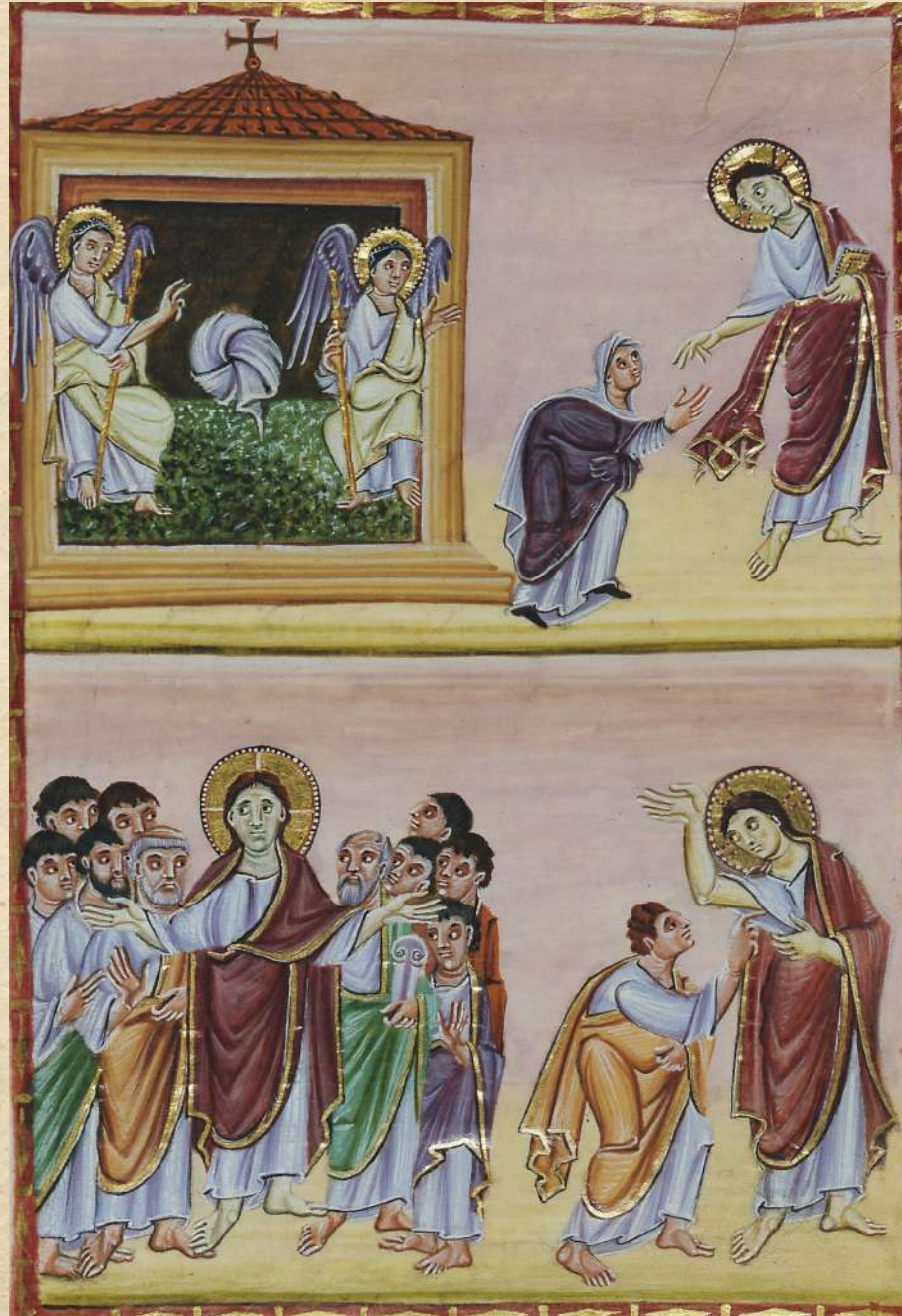
Apparition aux Apôtres

Le tombeau vide. Apparition à Marie-Madeleine