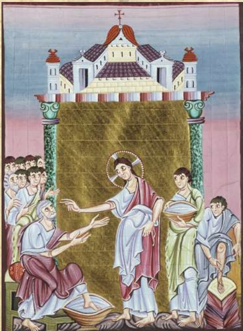
Le lavement des pieds

Si donc moi, le Seigneur et le Maître, je vous ai lavé les pieds, vous aussi, vous devez vous laver les pieds les uns aux autres. C'est un exemple que je vous ai donné afin que vous fassiez, vous aussi, comme j'ai fait pour vous.